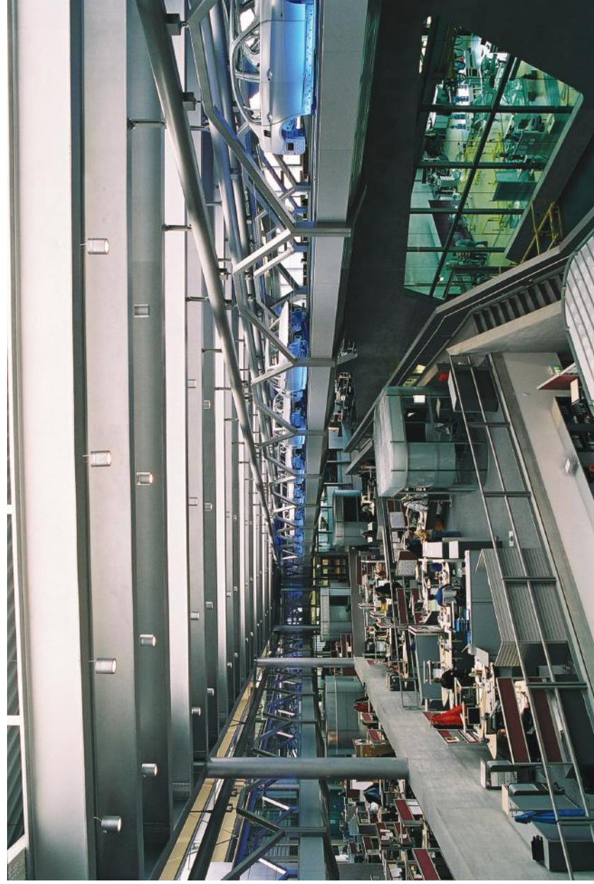
צלום: Bmw Werk Leipzig : تصوير: