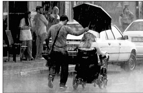
An act of kindness

I Many people believe that helping others is good for our health. Research shows that this is true. For example, some studies have found that people who spend money on others have fewer heart problems. Other research shows that people who do volunteer work feel happier. But can we also benefit from watching others do an act of kindness? Research that was published recently studied this question.