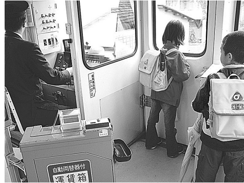
Japanese children on subway

I In Japan, parents regularly send their kids out into the world alone at a very young age. A popular television program shows children who are only two or three years old going out to buy food for their family at the neighborhood store. Moreover, you can often see children as young as six or seven without their parents on city trains. They are on their way to school either alone or in small groups. They usually have their tickets attached to their schoolbags.