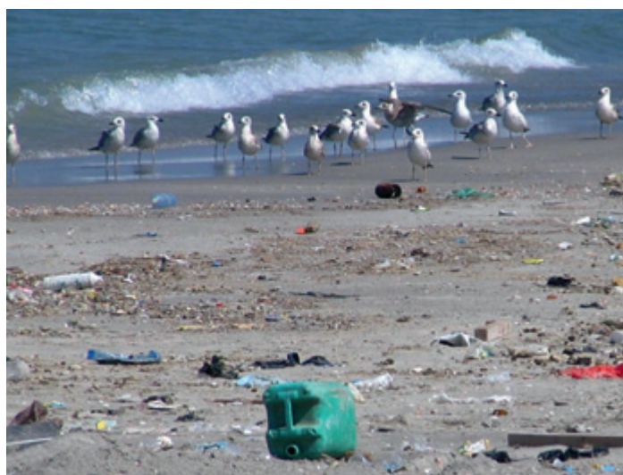
(2) נחל הקישון / وادي الكيشون

צילום: ד"ר אילן מלסטר באדיבות אתר המשרד להגנת הסביבה תصوير: د. إيلان ملستر من موقع وزارة حماية البيئة