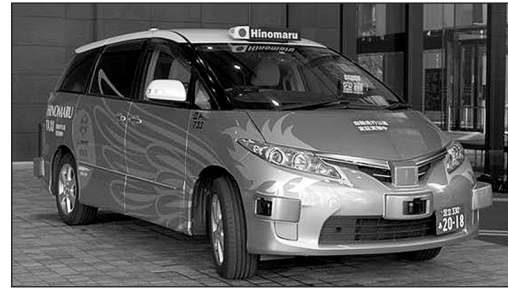
A driverless taxi

II Today, driverless taxis* take passengers only between two neighborhoods in Tokyo. Passengers pay for the ride on their cell phones. One of the first passengers to use this kind of taxi said, "The ride was so pleasant that I almost forgot there was no driver." However, there is someone from the company in the car to help if something goes wrong. But, so far, there were no problems.