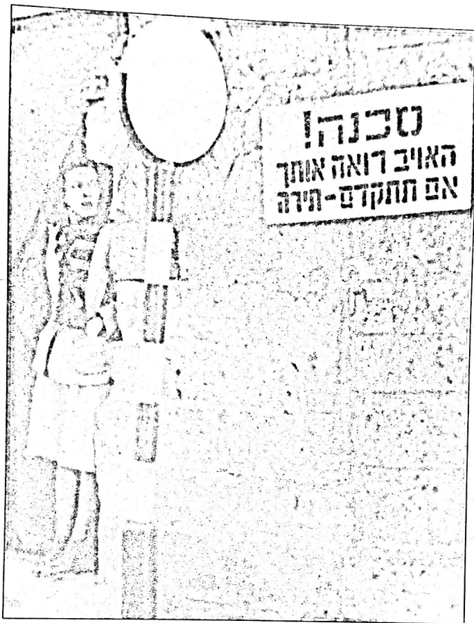
(הרמון, ל' [עורכת]. [1983]. תולדות עם ישראל בדורות האחרונים. יחידה 11. תל אביב: האוניברסיטה הפתוחה, עמ' 14)